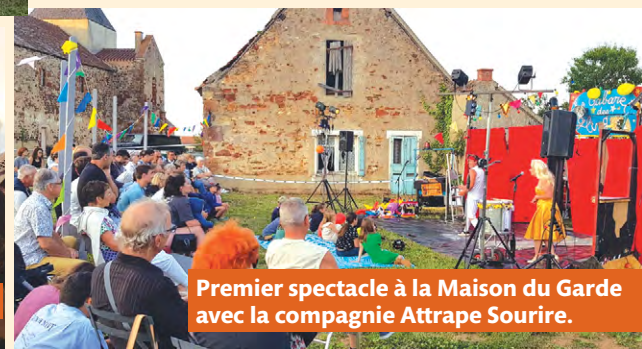
Premier spectacle à la Maison du Garde avec la compagnie Attrape Sourire.