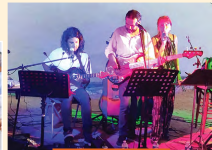
Fête de la musique.