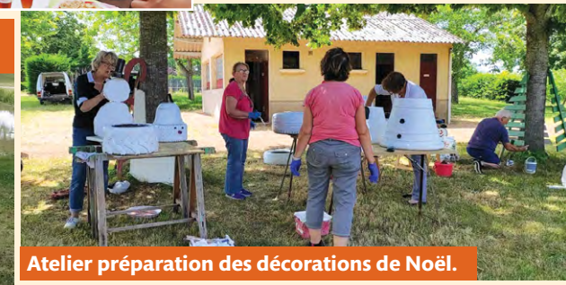
Atelier préparation des décorations de Noël.