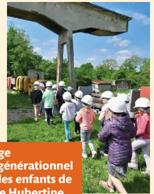
Voyage intergénérationnel avec les enfants de l'école Hubertine Auclert à Noyant d'Allier.