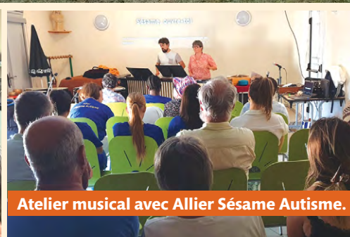
Atelier musical avec Allier Sésame Autisme.