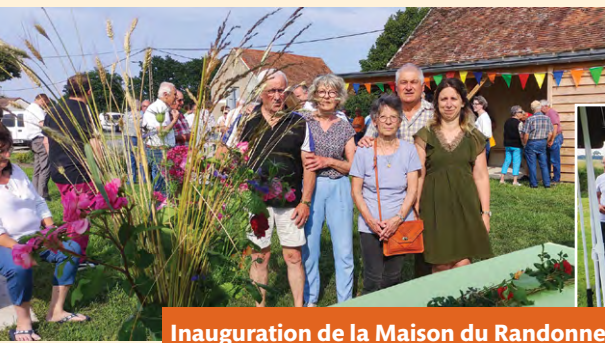
Inauguration de la Maison du Randonneur.