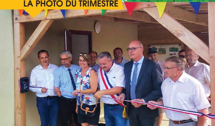
L'inauguration de La Maison du Randonneur le 16 juin dernier, en présence du sous-préfet Jean-Marc GIRAUD.