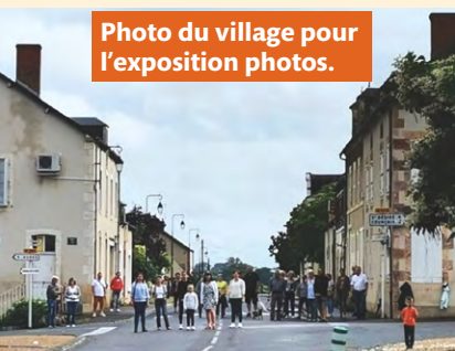
Photo du village pour l'exposition photos.