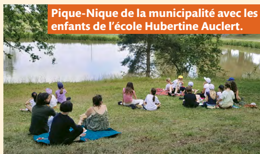
Pique-Nique de la municipalité avec les enfants de l'école Hubertine Auclert.