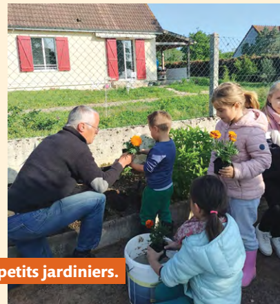
Les petits jardiniers.