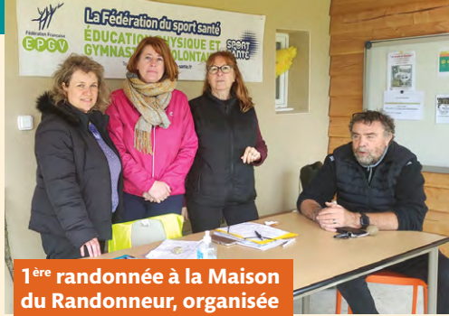
1 ère randonnée à la Maison du Randonneur, organisée par Gym Détente.

Encore un trimestre placé sous le signe des échanges, du partage, le bonheur simple de se retrouver et partager de beaux moments. Le temps fort restera l'inauguration de la Maison du Randonneur qui a connu un grand succès populaire. Merci à toutes et tous pour votre implication.