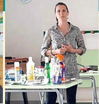
Conférence sur les produits ménagers et l'environnement