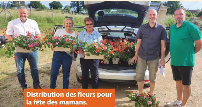
Distribution des fleurs pour la fête des mamans.