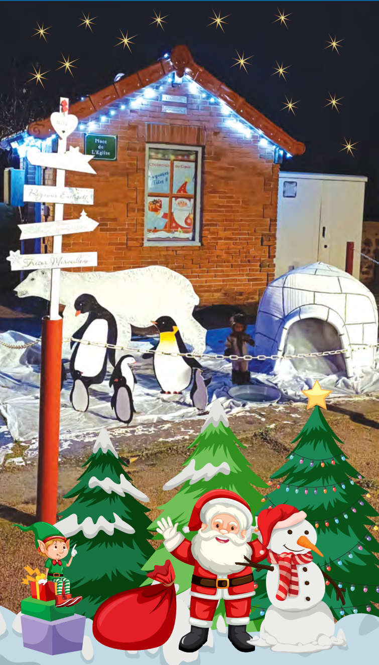
LA PHOTO DU TRIMESTRE