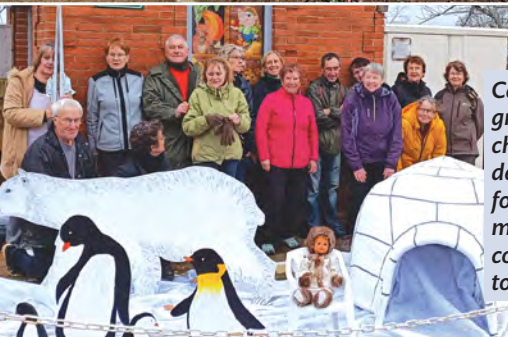
Cette année encore, le groupe de bénévoles, chargé des décorations de la commune, a fait fort, même très fort, pour mettre Chazemais aux couleurs de Noël. Bravo à toutes et tous et merci !!