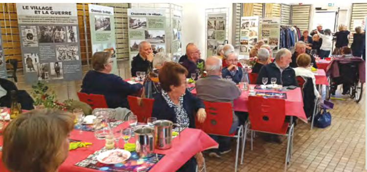
Repas des plus de 60 ans, superbe ambiance, superbe déco, autour du thème de la photographie et de l'expo photo, excellent repas, des danses, des chants, bref, vivement 60 ans !!