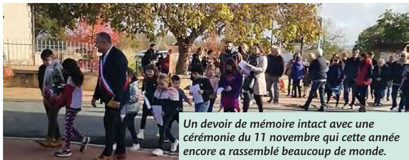
Un devoir de mémoire intact avec une cérémonie du 11 novembre qui cette année encore a rassemblé beaucoup de monde.