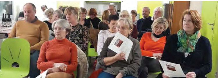
Avec le temps, l'atelier cuisine est devenu un incontournable de la vie de la commune. On y vient à plusieurs présenter des recettes et à la fin on déguste tous ensemble.