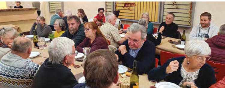
Devenue traditionnelle, la soirée Beaujolais Nouveau, organisée par le Grillon, a connu un grand succès. Plus de 100 personnes, au menu : charcuterie, tripes, beaujolais et bonne humeur.