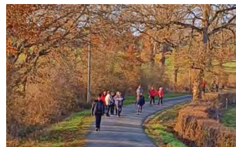
Dimanche 17 décembre, pour marquer dans la joie et la bonne humeur la fin de l'année 2023, la randonnée de Noël, organisée par l'Amicale Laïque et le Grillon, a rassemblé près de 120 marcheurs, dans une ambiance top et sous les soleil.