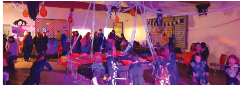
Encore une superbe organisation signée le GRILLON, pour la fête d'Halloween, une déco et une ambiance au top, des petits et des grands ravis.