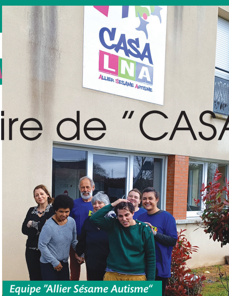
Equipe "Allier Sésame Autisme"

À partir de cette date, les activités vont aller crescendo. D'abord modestement, au jour le jour, les week-ends sous forme d'ateliers, modelage, arts plastiques..., puis en partenariat avec la Maison des associations de Montluçon et surtout grâce à des bénévoles avec un engagement sans faille. Par la suite, en 2007, "Allier Sésame Autisme" obtiendra le premier agrément de vacances adaptées qui permettra à l'association d'ouvrir son premier séjour. Ce seront 15 jours au Gîte communal de Chirat l'Eglise. En 2008, 1 mois de vacances réparti entre Chirat l'Eglise et Orléans ; l'année suivante, 2 mois, c'est parti, bien parti ! Les